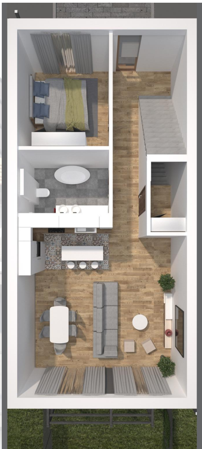
ZESTAWIENIE POWIERZCHNI - I PIĘTRO

Budynek: E Poziom: 1 Powierzchnia piętra: 77,27m 2