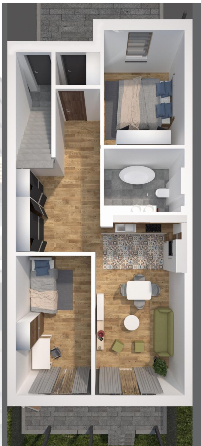
ZESTAWIENIE POWIERZCHNI - PARTER

Budynek: J Poziom: 0 Powierzchnia parteru: 67,91m 2