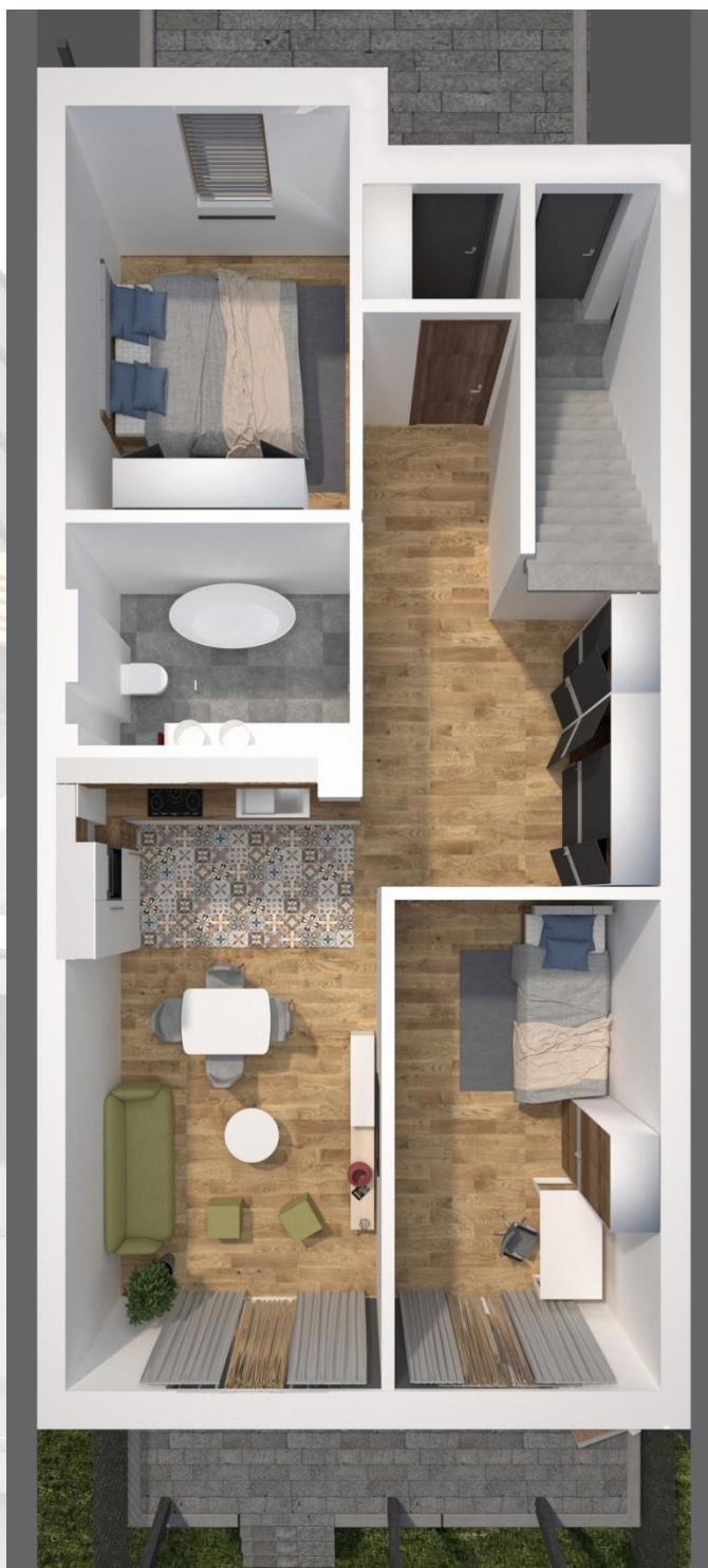
ZESTAWIENIE POWIERZCHNI - PARTER

Budynek: K Poziom: 0 Powierzchnia parteru: 67,91m 2